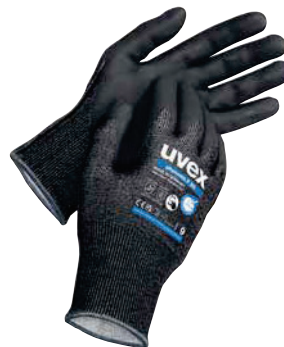
Art. no. 60068