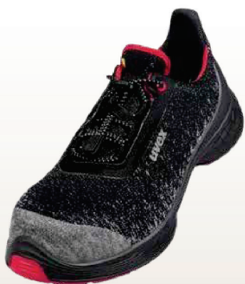
Art. no. 68528

cómodo y robusto para tareas en parques.