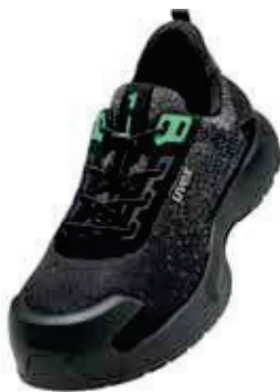
Art. no. 68082