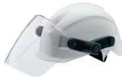
Art. no. 9770031