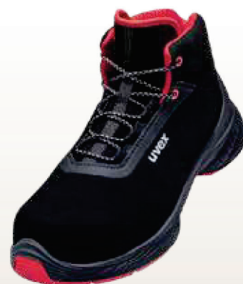
Art. no. 68392