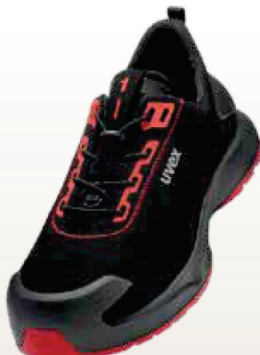
Art. no. 68032