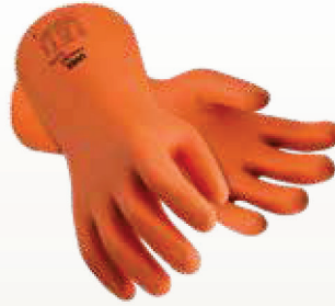
Art. no. 60188