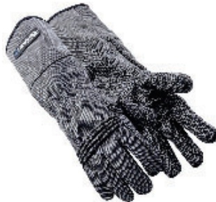
Art. no. 60548