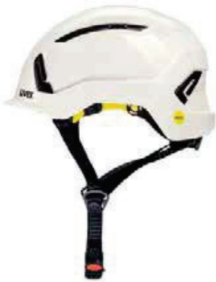
Art. no. 9735031