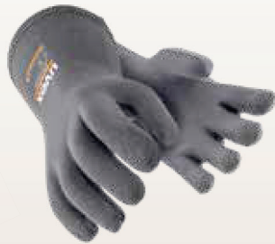
Art. no. 60838