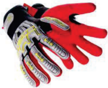
Art. no. 60666