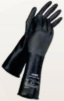
Art. no. 60949

con protección química, mecánica (cortes, impacto, punzamiento).