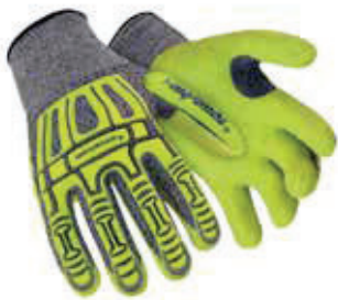
Art. no. 60648