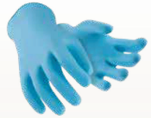
Art. no. 60167