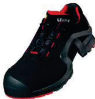
Art. no. 85161